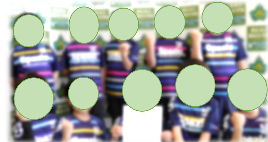
第13回フットサルコート開き親善交流Jrフットサル大会3年ブロック 準優勝 稲田サッカー少年団