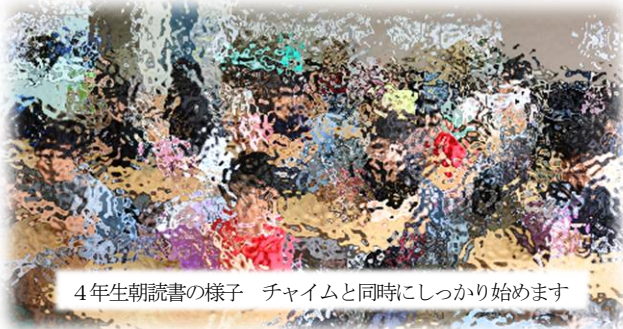
4年生朝読書の様子 チャイムと同時にしっかり始めます

もう一つの目標「チャイム着席」もとても意識できています。自分たちで時間を考えながら行動できるようになってきています。