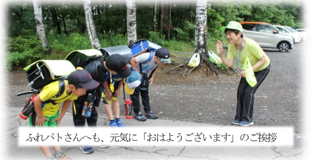
ふれパトさんへも、元気に「おはようございます」のご挨拶

挨拶から人間関係が始まると言われています。2学期は、全校児童が進んであいさつができるように取組を進めていきたいと思っています。