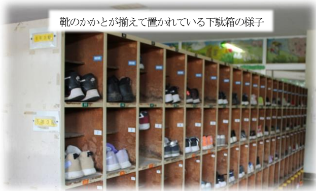
靴のかかとが揃えて置かれている下駄箱の様子

場を清めるの2つの目標ですが、ずいぶん気をつけて取り組めるようになってきました。個人差はありますが、身の回りを整えようとする意識が高まってきました。