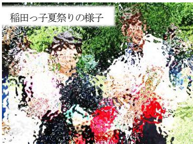
稲田っ子夏祭りの様子

この1学期間、保護者の皆様、地域の皆様の多大なるご理解とご協力のもと、充実した教育活動を行えましたことに感謝申し上げます。ありがとうございました。