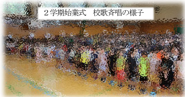
2学期始業式 校歌斉唱の様子

今年の夏休みは30度越えの真夏日が当たり前のように続き、35度越えの猛暑日になることも珍しくありませんでした。熱中症警戒アラートが発令され、外での活動が制限されるなど、北海道とは思えないほどの暑い暑い夏休みでした。