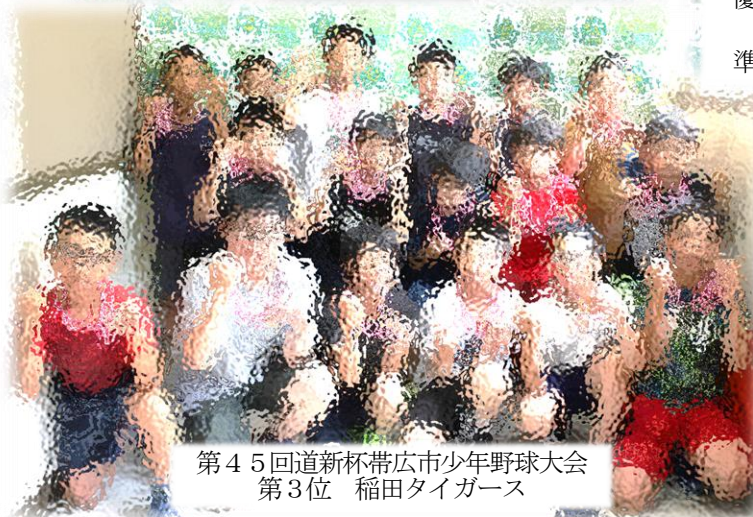
第45回道新杯帯広市少年野球大会 第3位 稲田タイガース