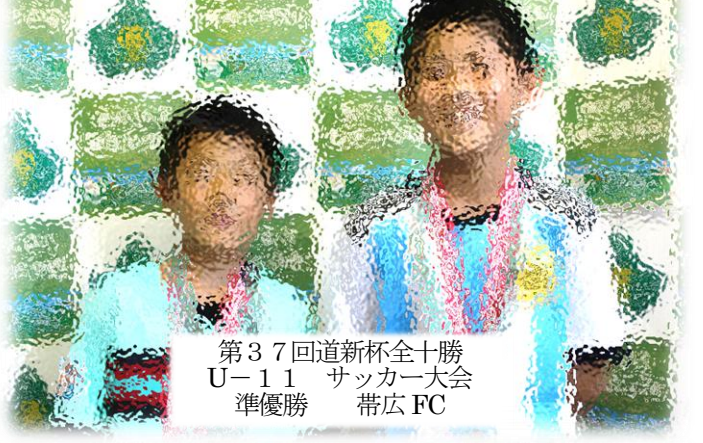
第37回道新杯全十勝 U-11 サッカー大会 準優勝 帯広 FC