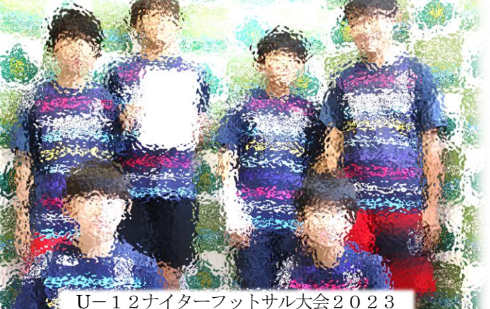
U-12ナイターフットサル大会2023 優勝 稲田サッカー少年団