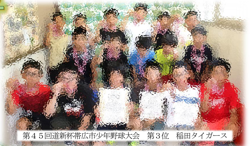
第45回道新杯帯広市少年野球大会 第3位 稲田タイガース