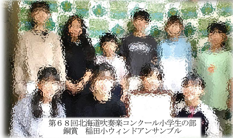
第68回北海道吹奏楽コンクール小学生の部 銅賞 稲田小ウィンドアンサンブル