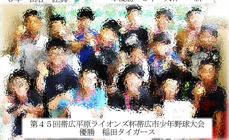
第45回帯広平原ライオンズ杯帯広市少年野球大会 優勝 稲田タイガース