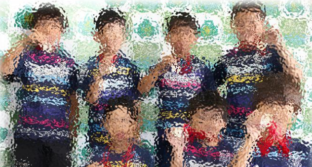
帯広かしわライオンズクラブ会長杯1～3年の部 優勝 稲田サッカー少年団B