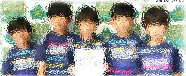
第22回十勝フットサル連盟会長杯ジュニア フットサル大会 準優勝 稲田サッカー少年団