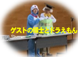
ゲストの博士とドラえもん