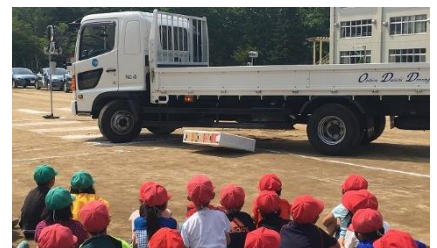
第一自動車学校による交通安全教室

さて、本校校区は交通量が激しいので、朝の登校については同じ時間帯にまわって登校すること(8:00～8:20)、できるだけふれあいパトロールの方が立っている横断歩道を渡ることを指導しています。特に共栄通は朝の時間帯の車の量が多いので、「横断するときは止まって確認」を指導していますが、ご家庭でも家を出る前に一言お願いします。PTAの皆さんにも見守り・挨拶運動をしていただき感謝しています。毎日の声かけが、子どもたちの安全意識を高めます。