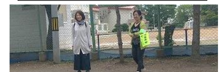
PTAによる朝の見守り・挨拶運動