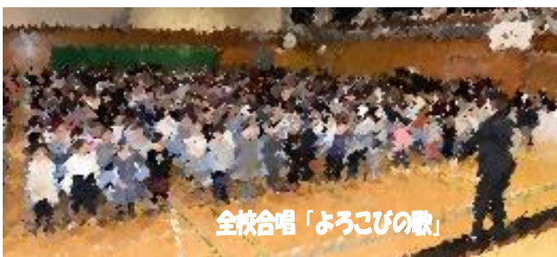
全校合唱「よろこびの歌」

協賛会役員の皆様、お手伝いいただいたPTAの皆様、早朝より本当にありがとうございました。「神対応」という言葉が聞こえるほど、すばらしいお心づかいと連携プレーに心から感謝・感激しています。