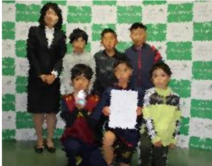
二〇一八 冬のサッカーフェスティバル 三年生クラス午後の部 準備勝 稲田サッカー少年団B