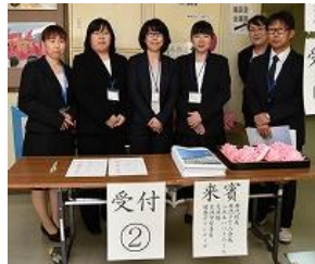
役員とお手伝いの皆様に感謝！