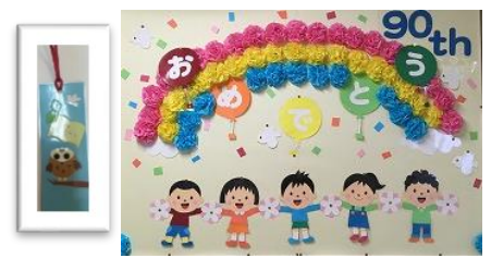
図書ボラから全校児童にしおりをいただきました